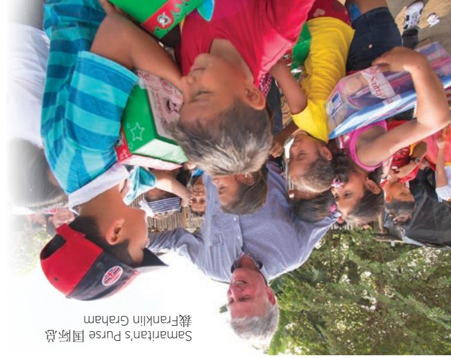
Samartan's Purse 国际总裁 Franklin Graham